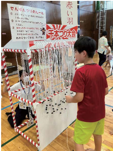
「南小校区夏祭り」での様子