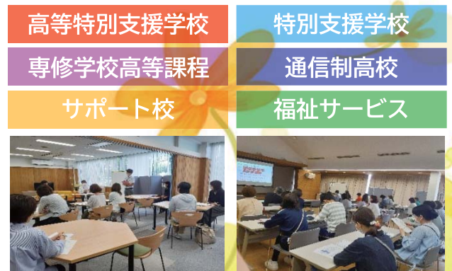
※昨年の勉強会はコロナ渦の中、多くの方にご参加いただきました。

進路選択に関わっている先生にお越し頂き、直接お話しできる貴重な機会です。ぜひご参加ください!!