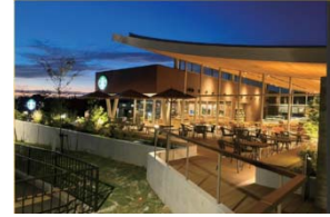
スターバックスコーヒージャパン 様