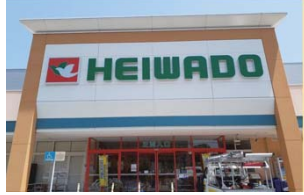
平和堂長久手店 様